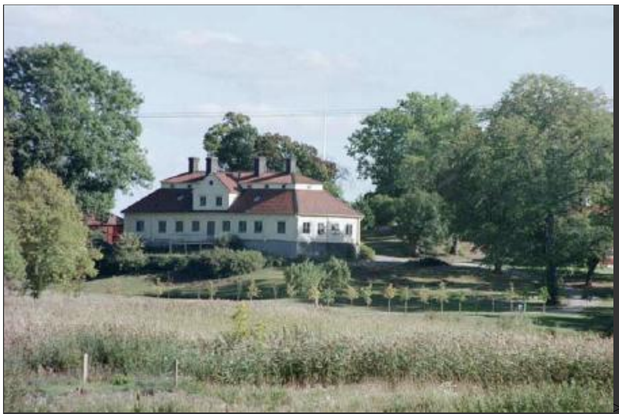
Råfsnäs (numera stavat Rävsnäs), foto Hans-Georg Wallentinus 1999.

Georg Nordensvan skriver i sin artikel i Ny Illustrerad Tidskrift att det var 13 kvinnliga elever i gruppen 1880 och i C. W. Jaensons handskrivna hågkomster sägs, att man var inalles 30 elever. Genom uppgifter från olika källor har det gått att identifiera 12 av damerna och flertalet av herrarna.