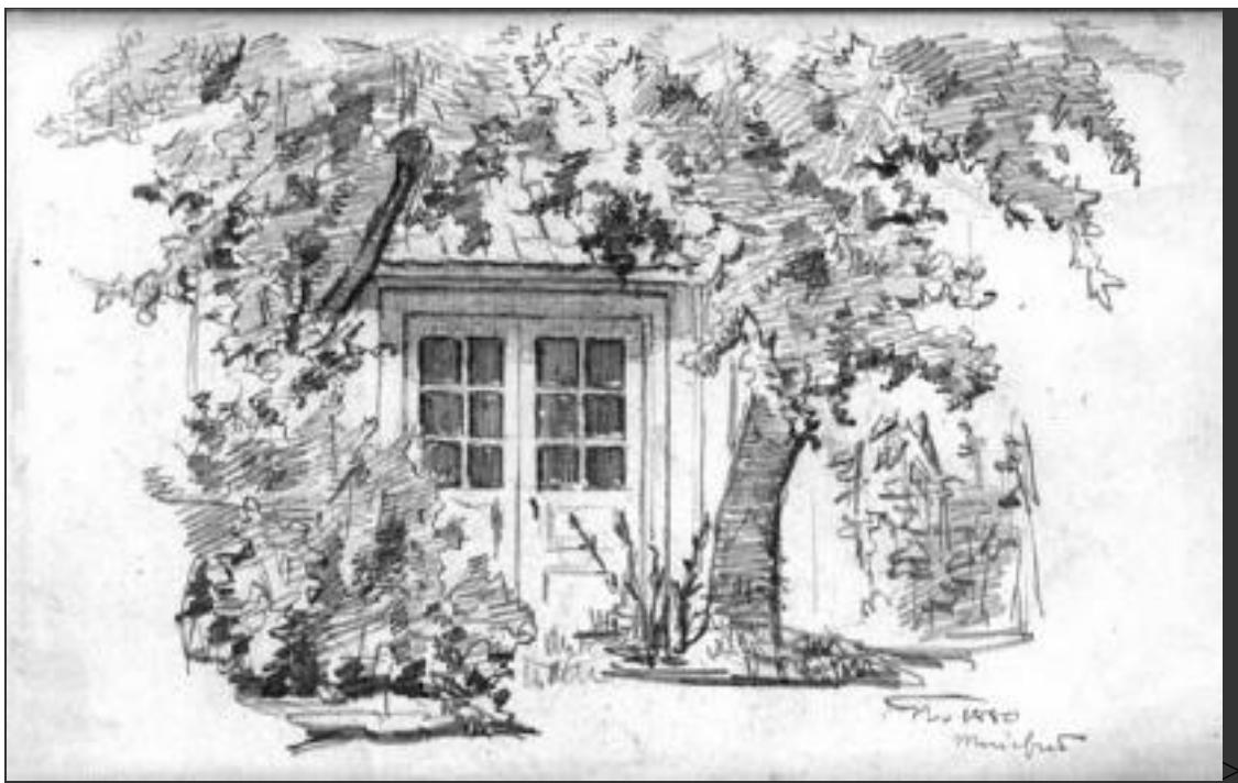
Motiv från Mariefred. Teckning av Georg Nordensvan 1880.