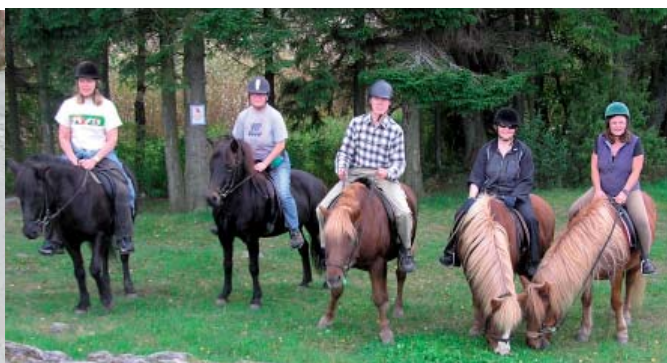
Vinterridning över Garnsvikens is t.v. Vi firar Lotten med en ridtur till Garnsvikens strand en av de sista sommardagarna i september t.h.