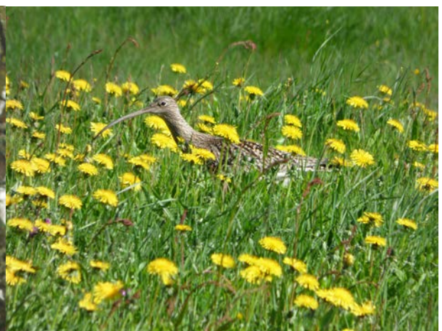
Vit stork i närheten av Stava är en av sällsyntheterna i bygden. Storspoven mötte oss fint vid midsommar i Kalix.