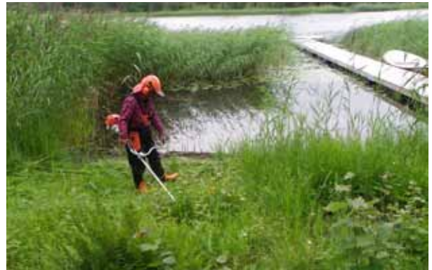
Överst Lovas målning. Nere t.v. en buskvårtbitare på besök i köket. En av alla gräshoppor och vårtbitare som finns på Sjöbacken. Nere t.h. Nu har lieslåttern blivit motoriserad, Sonia i arbetstagen.