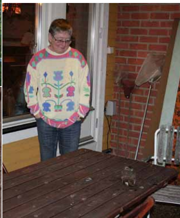
Turkdovor på rad i Halland. Sparvuggla är det senaste tillskottet på tomtlistan.