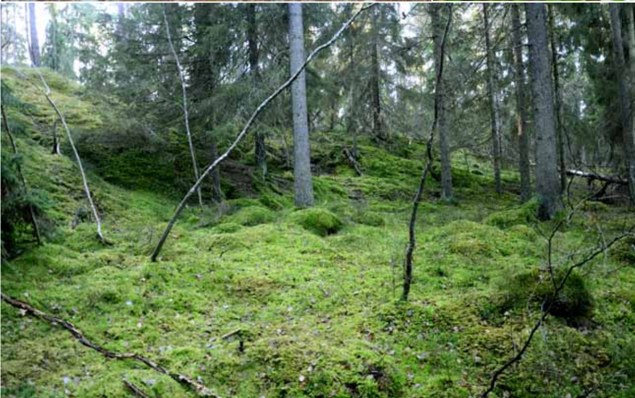
Högst upp till vänster - Ekhabitatnätverket har undersökts i flera projekt under 2011, här några ekar i Årstadal. Mitten till vänster - Hällmarker i Arkösund. Till höger - S:t Pers nycklar på Örsten, Singö. Längst ned - Mossig granskog i Trolldalsskogen, Lidingö.