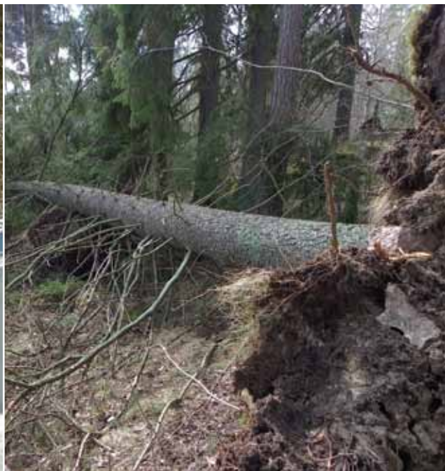
Vinter 2010-2011 var snörik och ganska kall, medan hösten 2011 blev lång och varm. Till höger ett av de träd på tomten som föll i stormen 7 april 2011.