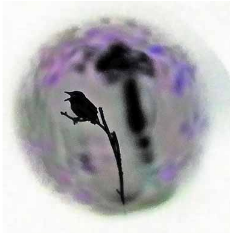
Träxsångaren i Jämtland lockade många fågelskådare, även Wallentinus x 3.