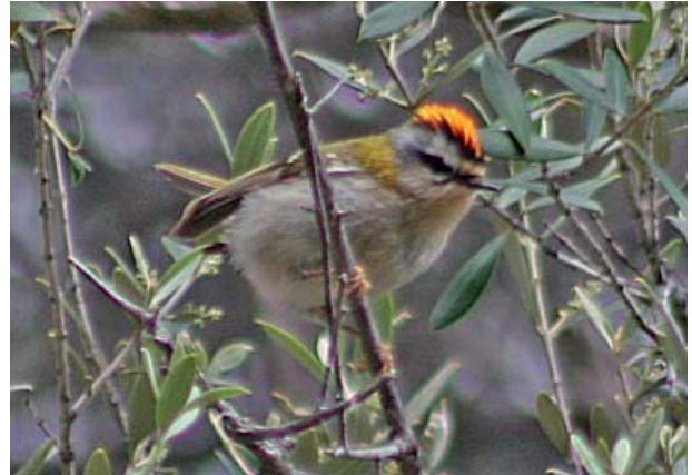
Brandkronad kungsfågel som blev galen när vi spelade upp artens sång från mobilen, därav den uppresta "kammen". Mallorca i april 2008.