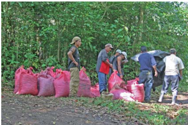
Kaffeplantage i norra Nicaragua, belägen i molnskogen på drygt 1000 meters höjd.

Under hösten har H-G jobbat med värdering av ett Natura 2000-område öster om Norrköpings tätort. Det visade sig också finnas ett våtmarksområde med häckande pungmes och ett flertal nattsjungande sångare. Här föreslås att väg E22 dras för att avlasta stadens centrum, en väg som många tar istället för att åka en omväg på någon mil förbi Norrköping och sedan tillbaka igen. Detta är ett intressant projekt i så motto att kommunen är angelägen om att avlasta stadens centrala delar, samtidigt som man verkar anstränga sig för att detaljplanelägga en massa områden på ön Händelö, där vägen skulle kunna ha drag-