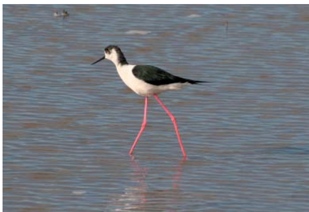
Styllöpare på Mallorca i april 2008.

Under hösten följer jag så med på två Stormurutflykter, första gången till Järvafältet. Det är en