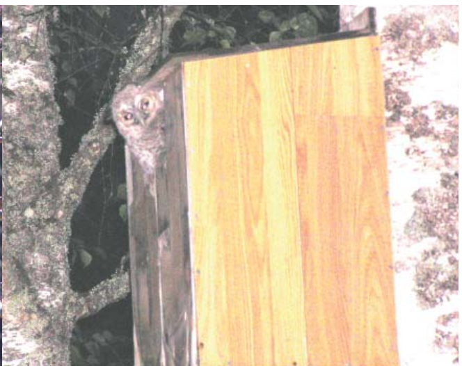
Stjörtmes och större hackspett besöker fågelbordet. Kattuggleungen tittar ut ur sitt bo - visst är han/hon lik ett skogstroll?