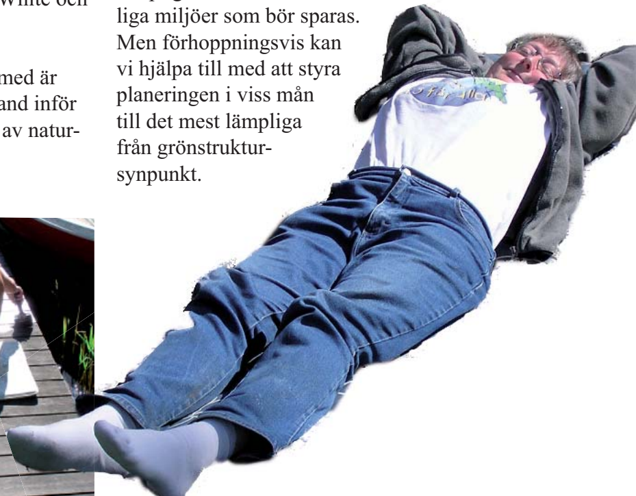
Men allt är inte jobb!

Bygg- och planeringsärenden har ju länge varit en specialitet för företaget. Ekologiskt underlagsmaterial inför bebyggelseplanering har lämnats i en del fall som t ex i Fors, Vendelsö och Vårberget. Några ärenden har varit alldeles i närheten av vårt tidigare hem i Täby Kyrkby, som vid Bällstaberg och Okvista. Det är ju med lite blandade känslor vi gör dessa utredningar där Storstockholm bli allt tätare och mer igenbyggt, medan vi ser om det finns lämpliga korridorer eller känsliga miljöer som bör sparas. Men förhoppningsvis kan vi hjälpa till med att styra planeringen i viss mån till det mest lämpliga från grönstruktur-synpunkt.